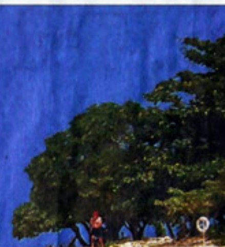
Türkisfarbenes Wasser, Sandstrand und Palmen: Auf Dimakya gibt es alles zusammen.