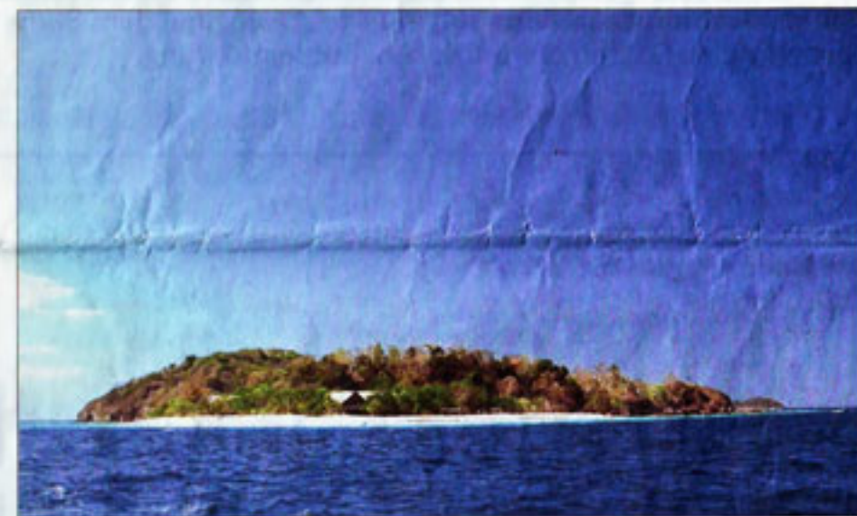
Ein Eiland wie aus dem Bilderbuch. Die kleinen Bungalows (unten) lassen sich auch bei Regenwetter durchaus ganz gut ertragen.